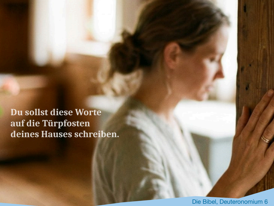
Die Bibel, Deuteronomium 6

Du sollst diese Worte auf die Türpfosten deines Hauses schreiben.